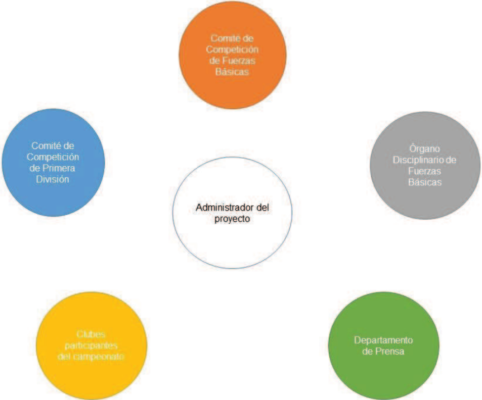
Figura 3. Red de comunicación del proyecto.

reportes semanales del desarrollo del proyecto. Por último, al finalizar el campeonato, el Concejo Director deberá elaborar un informe final sobre los resultados del proyecto.