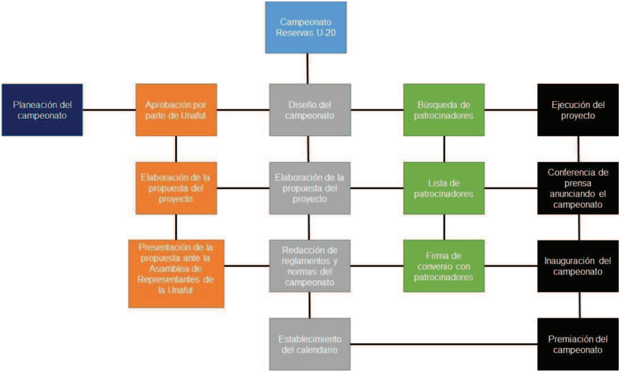
Figura 1. Estructura de desglose del trabajo.

A continuación, en la figura 1 se observa la Estructura de desglose del trabajo del proyecto: