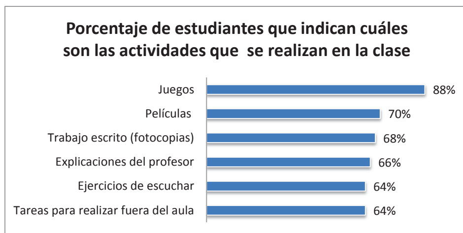
Gráfico # 2: Análisis de las actividades que se realizan en las clases de inglés.

El gráfico # 1 muestra las actividades que motivan a los estudiantes a aprender. La mayoría de los estudiantes, un 87% apunta que son los juegos. Un 64% opina que los videos y las películas. Un 46% las dinámicas y un 44% las dramatizaciones.