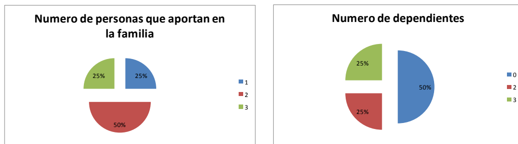
FIGURA 2 APORTES Y DEPENDENCIAS EN EL GRUPO FAMILIAR

Se puede detectar una pequeña brecha en el enfoque social del proyecto. En la Figura 2 se puede notar que solo el 25% de los empleados del centro de acopio son contribuyentes al grupo familiar. En el resto de los casos existen 2 ó 3 salarios que suman a los ingresos familiares. Sumado a lo anterior, existe el hecho que el 50% de colaboradores del centro de acopio no tiene personas dependientes.